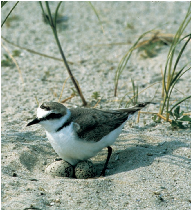
Seeregenpfeifer brüten in flachen Mulden am Sandstrand. Die Eier sind durch ihr Farbmuster kaum vom sandigen Grund zu unterscheiden.

Südlich der Pfahlbauten in Böhl endet das Reitgebiet; in Richtung Süden darf die Sandbank nur zu Fuß betreten werden, da dort regelmäßig Vögel und Seehunde rasten. Außerdem brüten an mehreren Stellen See- und Sandregenpfeifer, für die ungestörte Lebensräume selten geworden sind. Der Bestand der Seeregenpfeifer ist stark rückläufig. In den letzten Jahren brüteten auf der Böhler Sandbank jeweils etwa 25 Paare. Zum Schutz dieser letzten Brutpaare im Nationalpark werden um die jährlich wechselnden Brutplätze flexible Schutzzonen errichtet. Diese Schutzzonen dürfen (ebenso wie die Zone 1) auch von Fußgängern nicht betreten werden.